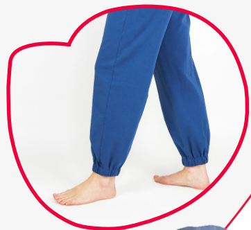
HOLLY cosy ohne Tasche